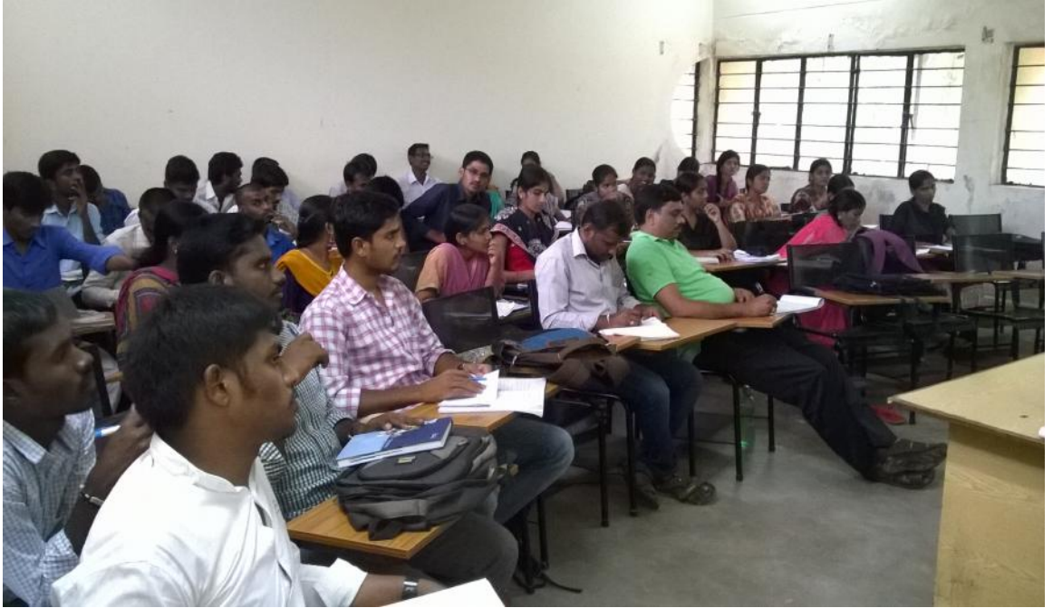
వత్రాలను వింటున్న విద్యార్థులు